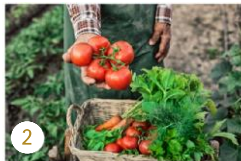
2 Nebelschütz – 1 Hektar Permakultur-Plantage