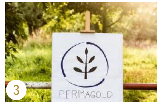
3 Der Aufbau Teil II