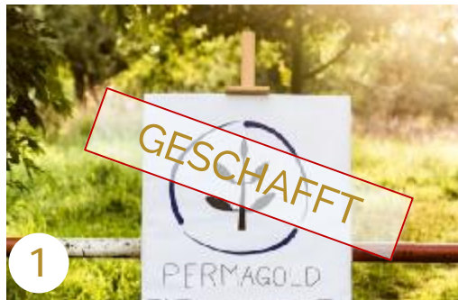
1 Der Aufbau Teil I